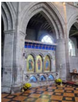
Восстановленная рака св. Давида в соборе Сент-Дейвидс

малое добро... Делайте те малые дела, что делал я: их вы видели и о них слышали. Я иду той дорогой, которой наши отцы шли до нас».