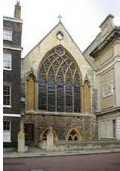
Церковь св. Этельдреды в Или- Плейс, Лондон

Красивая улица Холборн, расположенная близко к центру Лондона, является одной из самых древних в столице (впервые упоминается в 959 году). Свое название Холборн получил от протекавшей здесь речки. За всю историю улицы здесь жили и лондонские судейские чиновники, и ювелиры, но самым знаменитым жителем является Чарльз Диккенс, описывавший район в ряде своих романов. Холборн славится множеством архитектурных памятников. Одна из главных его жемчужин – церковь св.