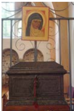
Мошевик, где хранятся частицы мощей святой Мильдреды