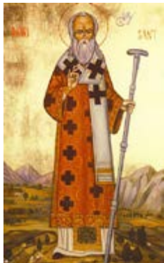
Святитель Давид Меневийский

Святитель Давид, архиепископ Меневийский, один из величайших и наиболее любимых святых Уэльса, родился около 500 года. Дошедшее до нас его житие, написанное около 1090 года, является одним из лучших средневековых литературных памятников, описывающих жизнь и организацию раннего кельтского монастыря. С незапамятных времен Давида, великого чудотворца, почитают главным покровителем Уэльса. Матерью Давида была святая Нонна, которая происходила из королевской семьи Диведа в Уэльсе. Позднее она приняла монашество и преставилась в Бретани. Давид творил чудеса уже в утробе своей матери. Однажды беременная Нонна зашла в церковь послушать проповедь. И вдруг священник на время потерял дар речи. Чудо было истолковано так: младенец, которого носит Нонна, превзойдет святостью жизни всех валлийских учителей веры. С детства Давид отличался благочестием и любовью к Церкви. Уже в очень молодом возрасте он стал монахом и священником. Обучался основам монашеской жизни в различных монастырях Уэльса. Надо сказать, что ко времени Давида в Уэльсе уже существовала довольно развитая Церковь и монашеская жизнь, но именно Давида Господь избрал величайшим святым валлийского народа, строителем более десяти монастырей и учредителем единого духовного центра. Поистине Давид наполнил всю валлийскую землю необычайным духом святости и аскезы, обеспечив страну огромным духовным потенциалом на долгие годы.