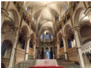
Своды Кентерберрийского Собора

Аббатство святого Августина, основанного в 7 веке святителем Августином, долгое время являлось местом захоронения королей Кента и архиепископов Кентерберрийских. Теперь на месте величественного монастыря остались лишь развалины внушительных размеров. Кто-то из паломников заметил: «Обратите внимание на ширину стен! Они были больше полутора метров!». В настоящее время аббатство является памятником Всемирного наследия ЮНЕСКО.