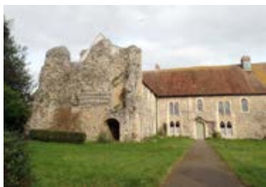
Римско-католический бenedиктинский женский монастырь св. Мильдреды Минстерской

Кентерберийского, апостола англов и чудотворца.