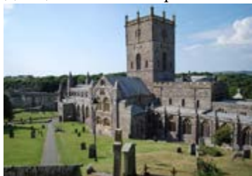
Кафедральный собор в Сент-Дейвидсе

Около 545 года Давид принял участие на Церковном Соборе в Лландеви-Бреви. На Соборе была осуждена ересь Пелагия и были обсуждены вопросы дисциплины. Во время Собора Давид так красноречиво говорил и был так