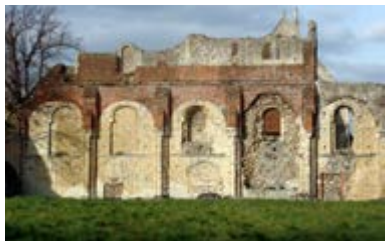
Аббатство святого Августина, Кентерберри

его мощей. Далее – переезд к церкви святителя Мартина в Кентерберри, «самой старой церкви во всем англоговорящем мире», как гласит надпись на щите перед церковью. Разумеется, церковь много раз перестраивалась и достраивалась, но именно в этом месте принял святое крещение король Этельберт. Надо отметить, что его доброе отношение к христианству было обусловлено и тем, что его жена, благочестивая Берта, французская принцесса и королева Кента, была христианка. В церкви ей установлен небольшой памятник в виде деревянной фигуры.