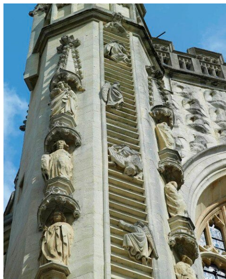
Западный фасад аббатства в городе Бат, Сомерсет.

увидеть православную икону св. Альфеджа и витраж, изображающий помазание на царство св. Эдгара святителем Этельвольдом. С внешней стороны на западном фасаде церкви аббатства помещены фигуры ангелов (в память о видении О. Кинга на этом месте), а также апостолов. В восстановленных подвалах церкви действует интереснейший музей наследия аббатства Бата. Эта уникальная церковь имеет 70 метров в длину, 25 метров в ширину, вмещает более 1000 человек и славится своими музыкальными традициями. Церковь аббатства издавна известна в народе как «светило запада», ведь 52 окна огромного готического здания служили