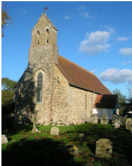
Церковь св. Богородицы в Чидхэме, Западный Сассекс.