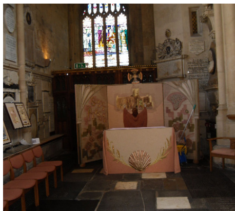
Часовня св. Альфеджа в аббатстве города Бат, Сомерсет.

величественный, огромный собор и монастырь в романском стиле. С той поры Бат пользовался славой великого духовного и монашеского центра. Некоторые камни той постройки сохранились. Самым известным ученым-выходцем из Бата был Аделард (1080-1152), который в 1120 году одним из первых в Европе ввел арабскую систему счисления (индийско-арабский способ обозначения чисел десятичной позиционной системы счисления). В 1245 году епархия Бата была преобразована в «епархию Бата и Уэллса».