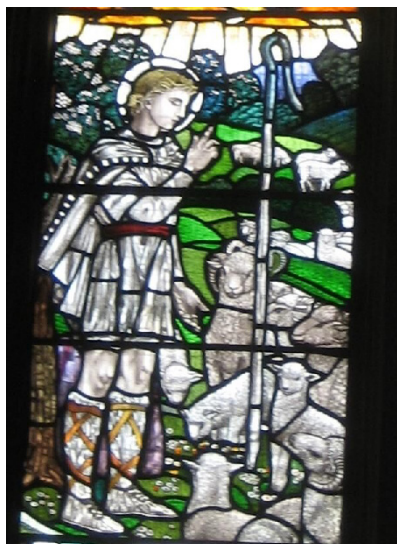
Святой Кутман-пастырь. Витраж.

С детства Кутман чтит своих родителей, во всем их слушался и посвящал много времени молитве; он усердно работал, помогая родителям, и пас овец. Отец