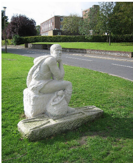
Святой Кутман. Скульптура работы Пенни Рива, установленная в Стейнинге.