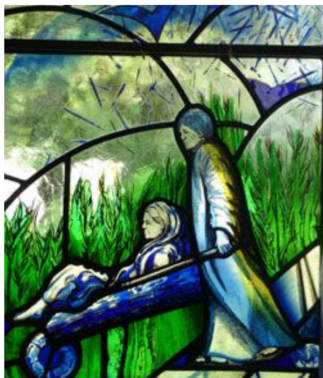
Святой Кутман. Фрагмент витража внутри церкви св. Богородицы в Чидхэме, Западный Сассекс.

Сначала он построил маленькую хижину для себя и матери. Местные жители помогали святому в строительстве храма. Но некоторые не пожелали этого делать и стали смеяться над ним. Их тут же постигла Божья кара: вдруг полил такой мощный ливень, что все их сено пропало. Вскоре маленькая церковь была почти готова, оставалось установить лишь кровельную балку; Кутман не знал, как это сделать. Тут перед ним появился незнакомец и показал, как закончить крышу. Кутман поблагодарил незнакомца и спросил его имя, на что он ответил: «Я тот, в честь кого ты строишь храм». И святой понял,