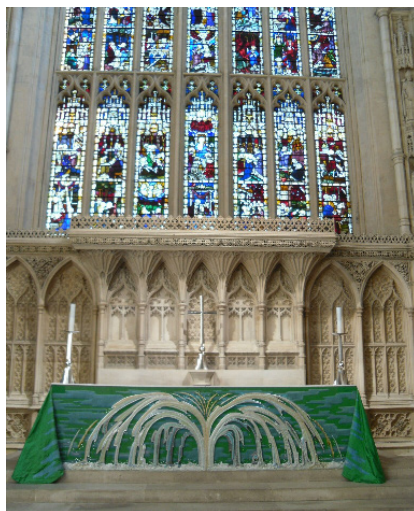
Часть знаменитого витража в алтаре аббатства города Бат, Сомерсет.

Величественный храм может похвастаться множеством достопримечательностей несмотря на восстановительные работы,