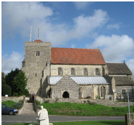
Церковь святых Андрея и Кутмана в Стейнинге, Западный Сассекс.

Нынешняя очаровательная церковь свв. Андрея и Кутмана в Стейнинге, стоящая на месте первоначальной церкви святого, относится к XIII