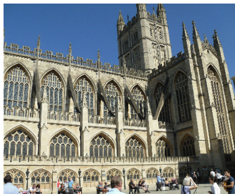
Аббатство в городе Бат, Сомерсет.

Первая женская обитель во имя апостола Петра появилась в этом бывшем римском городе еще в 670-е годы, когда Бат вошел в королевство Уэссекс. Монастырь достраивался в VIII веке, а в X веке стал мужским. Здесь в 973 году святитель Этельвольд Уинчестерский миропомазал святого благоверного Эдгара Мирного первым королем всей Англии. Эдгар покровительствовал духовному возрождению страны и занимался активным строительством монастырей, при нем православная Англия достигла пика своего процветания. (В 1973 году королева Елизавета II приезжала в церковь аббатства, чтобы отпраздновать 1000-летие этого важнейшего события). Священномученик Альфедж (Альфегий) – архиепископ