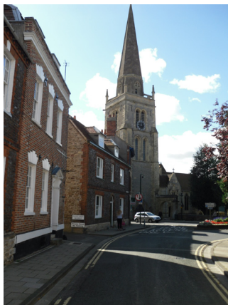
Средневековая церковь св. Елены в Абингдоне, Оксфордшир

Еще верующие посещают Абингдон – милый городок на реке Темза, считающийся самым древним городом Англии! В нем, помимо других святых мест, можно посетить церковь св. Елены, датирующуюся 1100 годом. Это одна из самых широких церквей в стране. Первую церковь здесь основал св. Бирин, но, согласно преданию, самая ранняя церковь основана самой равноапостольной Еленой, посещавшей Англию в IV веке вместе со своим сыном – императором Константином – который был коронован в Йорке в 306 году. Среди ее достопримечательностей: средневековая статуя св. Бирин, старинный витраж св. Елены и великолепное изображение «Древа