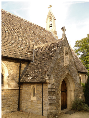
Католическая церковь свт. Бирина в Дорчестере-на-Темзе, Оксфордшир

Дорчестере. После смерти его сразу начали почитать как святого. В конце VII века святитель Хедда перенес часть мощей Бирина в Уинчестер. От мощей угодника происходило множество чудес, и тысячи паломников стекались к ним. В 1140 году на месте первоначального собора Бирина в Дорчестере был основан августинский монастырь, посвященный святым Петру, Павлу и Бирину, который просуществовал до Реформации. Король Генрих VIII в 1530-е годы закрыл обитель, но ее церковь, выкупленная прихожанами, сохранилась. Средневековая рака свт. Бирина восстановлена в 1964 году – она находится в южном боковом приделе этой церкви. Мощи просветителя Уэссекса, вполне вероятно, покоятся под ее полом. В церкви можно найти одни