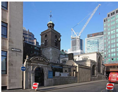
Церковь св. Олафа

памятник. После своей смерти сам Пипс был захоронен в склепе под престолом церкви рядом с братом и супругой, а большой памятник ему (как и великолепный древний бюст Элизабет) можно увидеть по сей день. В храме находится бюст известного врача и ботаника Питера Тернера (1542-1614), пропагандировавшего лекарственные свойства растений: он после смерти был здесь захоронен рядом со своим отцом Уильямом, который тоже был врачом. Знаменательно, что поскольку церковь находится близко от Лондонского Тауэра, именно здесь в 1554 году 21-летняя принцесса Елизавета Тюдор – будущая королева – отслужила благодарственную службу после освобождения из Тауэра!