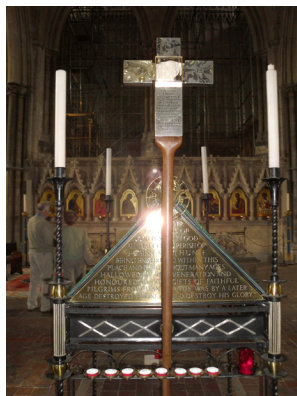
Крест свт. Бирина в Уинчестерском кафедральном соборе, Хэмпшир

Святитель Бирин преставился ко Господу 3 декабря 649 (или 650) года в возрасте 50 лет и захоронен в