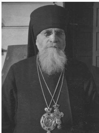
Хиротонию совершил архиепископ Клишиийский Николай (Ерёмин)

Но я не верю в случайность; я глубоко убежден в том, что Сам Господь Иисус Христос правит