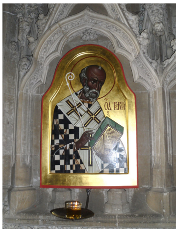
Икона свт. Бирина в Уинчестерском кафедральном соборе, Хэмпшир

Будущий святой родился в Ломбардии на севере Италии около 600 года. Нам ничего не известно о детстве и юношеских годах угодника, но достоверно, что до посвящения его во епископский сан Бирин подвизался монахом в одном из монастырей Рима. В 634 году в Генуе архиепископ Астерий посвятил Бирина во епископа, и в том же году папа