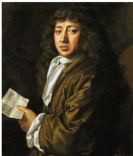
Портрет Самюэля Пипса. Художник Джон Хейлс, 1666

С храмом тесно связано имя чиновника Морского ведомства и автора знаменитых дневников о повседневной жизни лондонцев Сэмюэла Пипса (1633-1703). На протяжении 14 лет Пипс жил рядом с этой церковью, часто ходил на службы и называл ее «наш родной храм». После смерти его любимой жены Элизабет в 1669 году ее похоронили в церкви св. Олафа, где ей в алтаре воздвигли