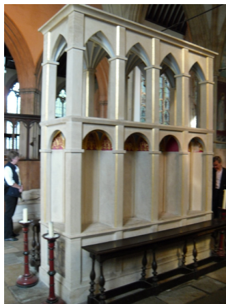
Восстановленная рака свт. Бирина в бывшей монастырской церкви Дорчестера-на-Темзе, Оксфордшир

Святые места, связанные с Берином, хранят память о нем. Прежде всего, это бывшая монастырская церковь свв. Петра и Павла в Дорчестере-на-Темзе. Каждый год этот большой, красивый и богато украшенный древний храм посещают тысячи паломников. Нынешнее здание относится к XII-XIV векам. Помимо храма здесь можно посетить музей аббатства, сады аббатства, чайную комнату аббатства и маленькую католическую церковь св. Бирина неподалеку. Местные жители утверждают, что регулярно видят по ночам силуэт св. Бирина, гуляющего по улицам городка и