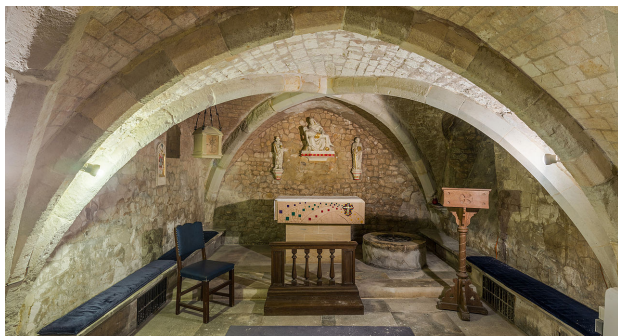
Крипта в церкви св. Олафа

Tower Hill (Circle and District lines), Tower Gateway (DLR), (Beckton branch terminus) and Fenchurch Street (mainline terminus)