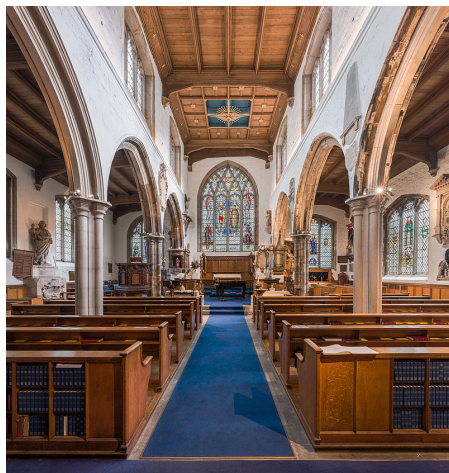
Внутри церкви св. Олафа

Эта древняя жемчужина лондонского Сити спрятана на маленькой улице Харт-Стрит. Она - одна из нескольких сохранившихся в Лондоне средневековых церквей. Церковь освящена в честь святого Олафа II Харальдссона (ок. 995-1030, память 29 июля), короля Норвегии в 1016-1028 годы, который ввел в стране христианство. В юности св. Олаф провел некоторое время в Англии, где помогал королю Этельреду Нерешительному воевать против завоевателей-датчан. В «Битве на Лондонском мосту» 1014 года (1), в которой участвовал Олаф, англичане разгромили датчан, и с тех пор