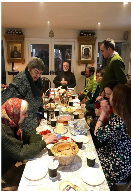
Завтрак после праздничной литургии в церкви св. Николая Чудотворца в Оксфорде