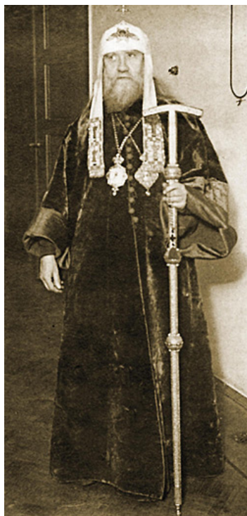
Один из первых снимков святителя Тихона в сане патриарха

в качестве «заложников»; этих несчастных убивают в отместку за преступления, совершенные лицами не только им не единомышленными, а часто вашими же сторонниками или близкими вам по убеждениям. Казнят епископов, священников, монахов и монахинь, ни в чем не повинных, а просто по огульному обвинению в какой-то расплывчатой и неопределенной «контрреволюционности». Бесчеловечная казнь отягчается для православных лишением последнего предсмертного