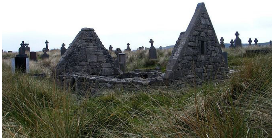
Остатки монастырской церкви "Teaghlach Einne" на острове Инишмор

Слава об игумене Энде разнеслась по всему острову Ирландия. Любовь и забота этого духовного отца распространялись не только на монахов, но и на бедных,