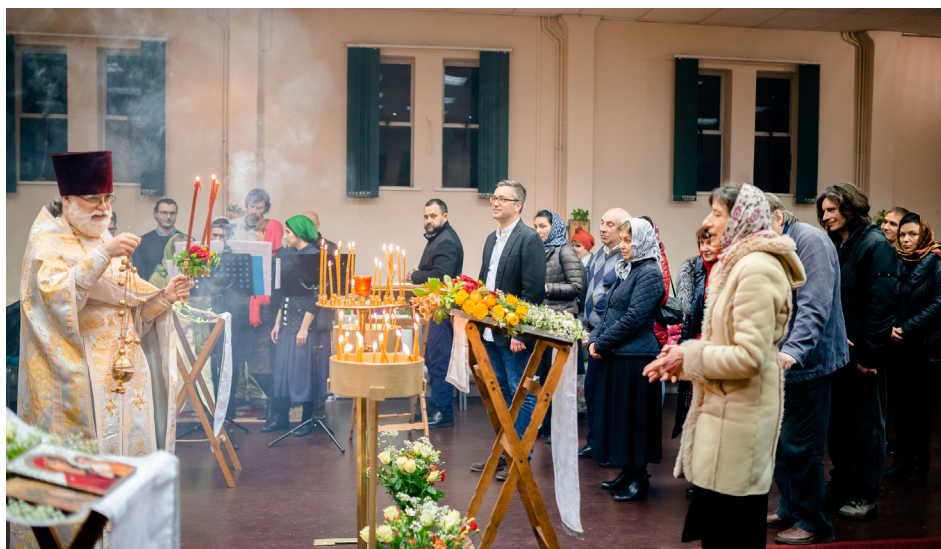
Здесь и ниже - приход св. Силуана Афонского в Саутгемптоне

всю ночь. А под утро для всех были накрыты столы со скромными угощениями. В воскресенье, в 13.00, отслужили вечерню, а затем приступили к праздничной трапезе.