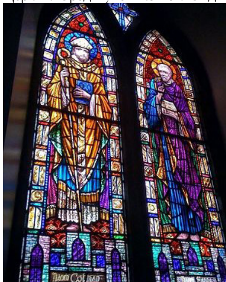
Витраж с изображением свв. Энды Инишморского и Колмана Килмакдуахского

Поначалу преподобный подвизался со 150 учениками. Вскоре монастырь вырос в знаменитый центр монашества, учености и созерцательной жизни. Тут постигали науку подвижничества многие светильники Ирландской Церкви. Среди учеников св. Энды