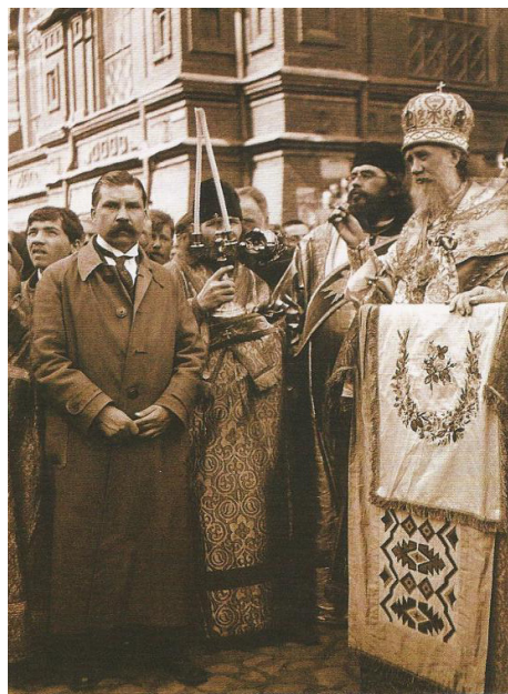
Патриарх Тихон служит молебен у Никольских ворот. Москва. 1918 год