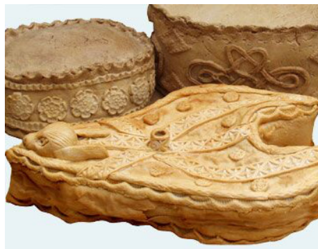
Заячьи пироги

Этот обычай, состоящий из двух частей, можно наблюдать на второй день Пасхи в Халлатоне, графство Лестершир. «Заячьим пирогом» назывался пирог, который пек священник местного прихода в средние века. Пирог разрезался на куски, и половина раздавалась участникам церковной процессии, а оставшиеся куски разбрасывали в поле «Берег пирога с крольчатинной»