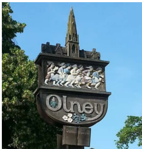
Забег с блинами на гербе Олни

«Подбрасывание блинчиков» - народный обычай. В последний день Масленицы пекут блинчики и переворачивают их, подбрасывая на сковородке. В «подбрасывании» участвует вся семья. «Бег с блинчиками» - популярные состязания домохозяек. По старинному обычаю бегущие подбрасывают блинчики на сковородке. На всю страну известен «Олнийский бег с блинчиками» - проводится в Олни, графство Бакингемшир. Подбрасывание блинчиков, особенно во время бега - это большое веселье, и, несомненно, неплохое спортивное «состязание». На масленицу женщины из Олни и близлежащего Уормингтона, надев на этот случай на себя фартуки и платки, вооружившись блинами и сковородками, собираются на деревенской площади. Отсюда они пробегают 400 метров до приходской церкви, по пути три раза подбрасывая блинчики, которые несут на сковородах. Победительница получает в подарок молитвослов, после чего все сковородки ставятся вокруг церкви и начинается служба благословения.