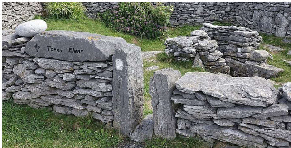
Источник святого Энды на острове Инишир (Источник - http://www.pravoslavie.ru/102550.html )

Источник: http://www.pravoslavie.ru/102550.html