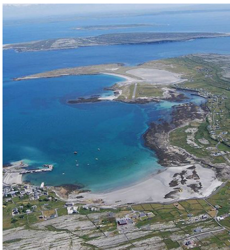
Аранские острова, Ирландия

страдающих и угнетенных. Св. Энда распорядился построить на Инишморе «восемь мест для пристанища», где мог найти приют те, кому больше некуда было идти.