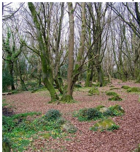
Аранские острова, Ирландия

В XV столетии на Инишморе был построен францисканский монастырь, просуществовавший чуть более 100 лет. В середине XVII века при Кромвеле многие святыни Инишмора