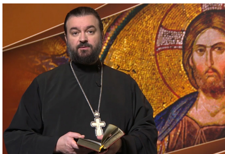
Протоиерей Андрей Ткачев

В пост мы, в общем-то, немножко были святыми: телевизор смотрели меньше или вовсе не смотрели, Псалтирь открывали, мяса на столе не было – всё было хорошо. А дальше что? Сейчас начнется мясоед, сейчас будем выпивать, закусывать,