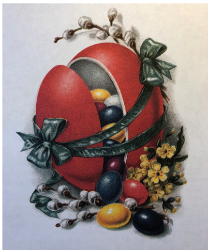
Иллюстрация из дореволюционного детского журнала "Светлячок"

Когда Иисус Христос умер на кресте, один из Его тайных учеников, знатный человек, которого звали Иосиф, получил разрешение снять Его тело с креста и похоронить Его.