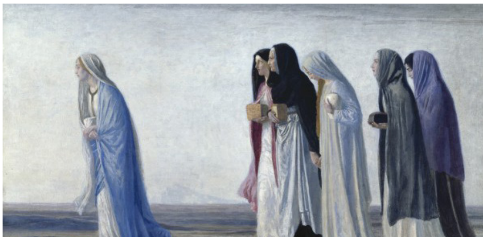
Жены-мироносицы - неудобные свидетельницы