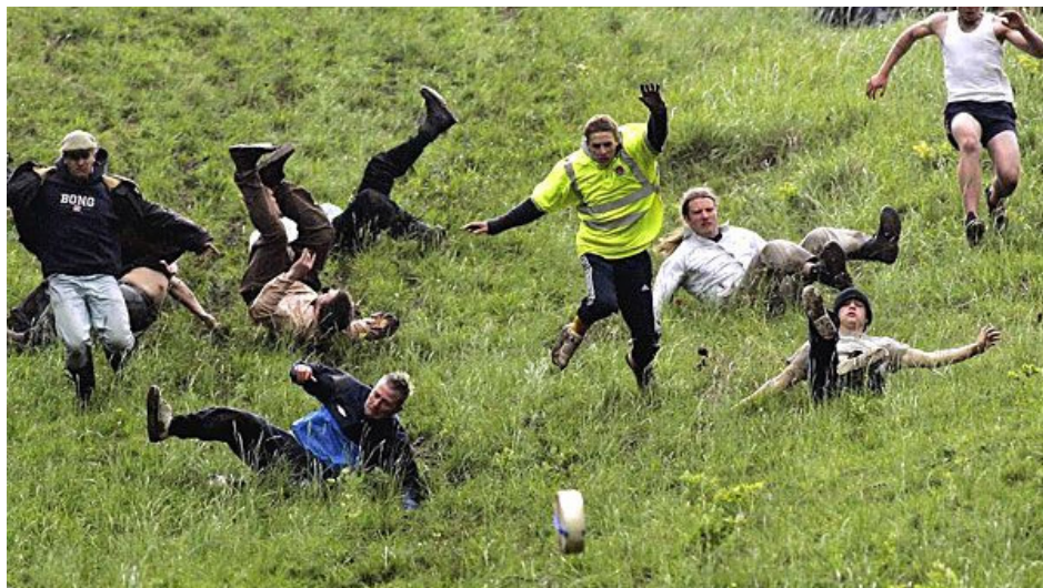
Катание сыра